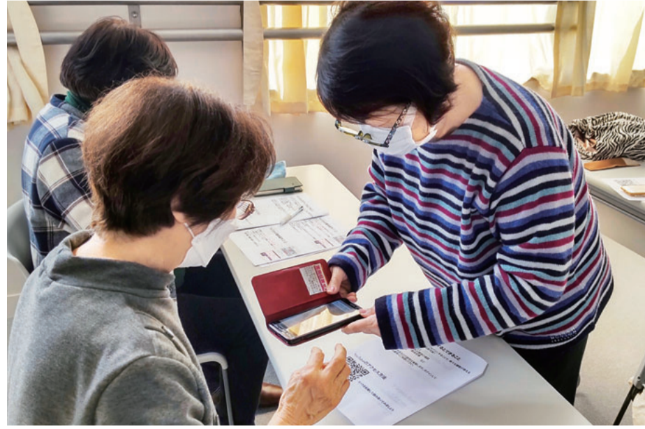
「そんなふうにするのね、よくわかったわ！」

講師は地域ささえあいセンター職員と南生協病院の看護師が担当し、普段使っているスマホと見比べながら教えていました。また「動画を見る方法がわかったので地域の班会でもやってみたい」と新たな班会が開催されそうです。