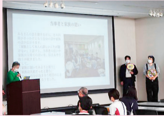
「ふらっとカムカム」でのがん哲学外来メディカルカフェふらっかムの紹介

よって横丁へ入るべく、その後は「かかりやすい事業所になるために」では南生協病院と小規模おさぼりの報告があり、その後のグループワークで交流を深めました。