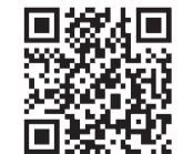
みなあんシャキッとしたいそう 二次元コード

かなめ病院リハビリテーション科では、2023年度は名南地域での普及活動を中心に行っています。