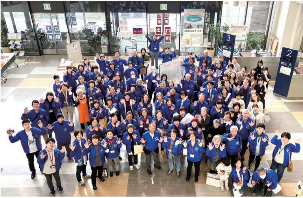
—第32回健康づくりフェスティバル— がんばった実行委員会のみなさん