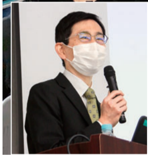
藤田医科大学 下野洋平教授