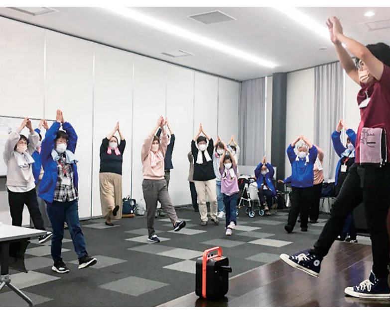
健康づくりフェスティバルでお披露目

2月23日に、生協のんびり村を拠点にしたボランティア組織、「たすくる東海みなみ」が発足しました。14年前、生協のんびり村が開設されたときに、ボランティア組織が結成されました。継続している草刈り班・体操班・村の保健室の他に新メンバーが加わり、体制を整えて、東海市南ブ