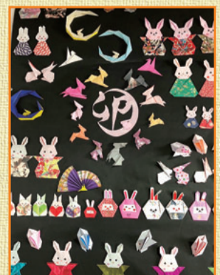
豊明市 折り紙班会の皆さん