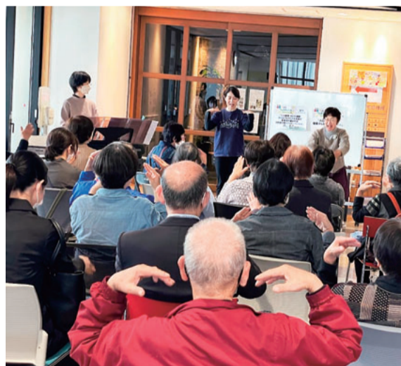
知多半島南・北ブロックの企画 「心も健康お口も健康 みんなでわやわや全員集合! 手話付き童話読み聞かせとロングピロピロ」

参加者からは、「とてもわかりやすいお話でよかった」「年をとればそれだけがんになる可能性が高くなるのがわかった」「やっぱり生活習慣を整えること