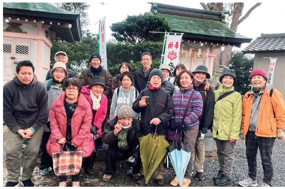
知多市ブロックのみなさん、愛知用水神社でにっこり

2月23日に、生協のんびり村を拠点にしたボランティア組織、「たすくる東海みなみ」が発足しました。14年前、生協のんびり村が開設されたときに、ボランティア組織が結成されました。継続している草刈り班・体操班・村の保健室の他に新メンバーが加わり、体制を整えて、東海市南ブ