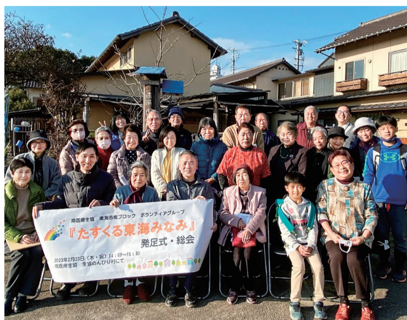
たすくる東海みなみ 発足式・総会

また、グループワークの発表をされた学生の方は中学生の頃からよって横丁で勉強していたとお話もあり大いに盛り上がりま