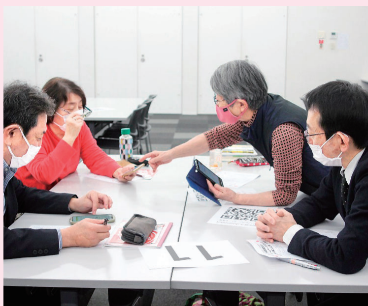
スマホの使い方を小グループで教え合いっこ。

第34回 まざりあい10万人会議 新しいホームページのお知らせ おたがいさまの家「二人三脚」からの近況報告 今回は、「新しくなった南医療生協のホームページ大活用」と「おたがいさまの家「二人三脚」の近況を共有しました。」 ホームページを活用するには、「スマホ班会」のように、参加者が小グループ