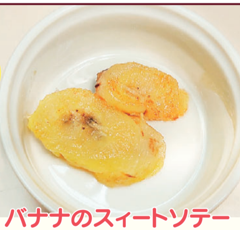
バナナのスイートソテー