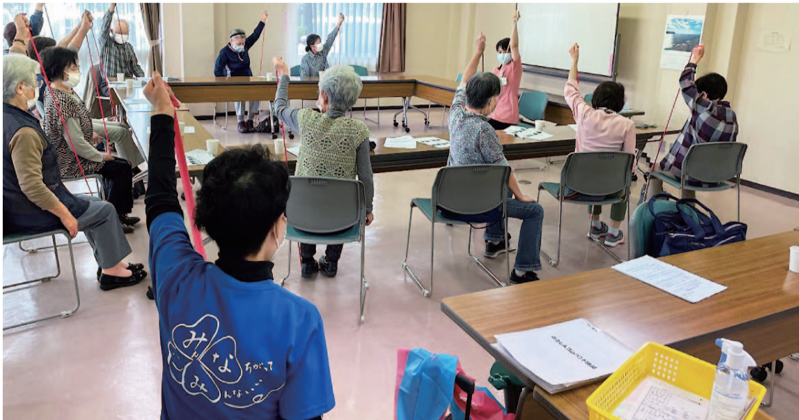
5/19(木)に開催された知多市南部支部の「ゴムバンド体操」合同班会の様子

南医療生活協同組合 〒459-8016 名古屋市緑区南大高二丁目204番地 052-625-0620(代) 編集部052-625-0650 ホームページ http://www.minami.or.jp/