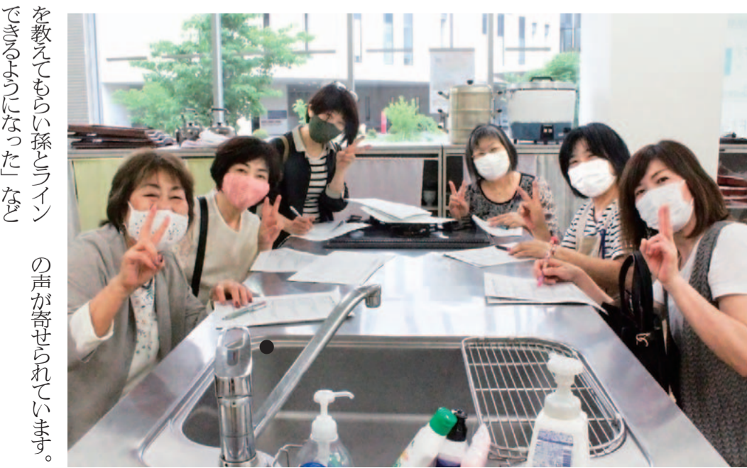
を教えるらしい係（ライン）の音が寄せられています。

そのうち学校 今年度のスローガン つながって 感動いっぱい 学べば青春！ テーマ 協育って楽しい！ そのうち学校は、「受講 するよ！事つくめ」とよ く言われます。その中でも 「友達が増える」という声 が一番多いです。昨年の第 一コースの受講者さんから は「何十年ぶりに子どもた ちと花火などをして楽し み、昔のことが思い出され ました。こうした機会を多 く持ち、子どもたちにいい 思い出をたくさん作ってほ しい」という声が寄せられ ました。他にも「違う地域 の人とも仲良くなれる」「職 員も参加しているの、職 員とも仲良くなれる」「若 い人からスマホの操作方法