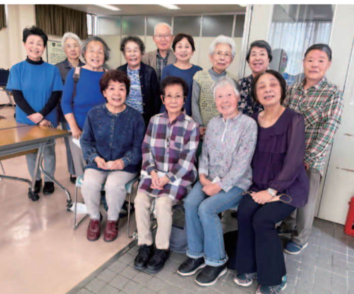
知多市南部支部の班会「三八(みや)の会」と「さとちゃんの健康教室」の皆さん