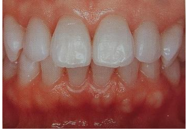
ホワイトニング後