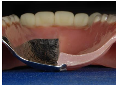
プラスチックと金属の差