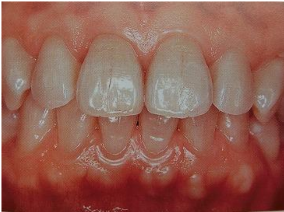
ホワイトニング前